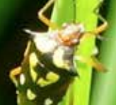
Chinche del arroz