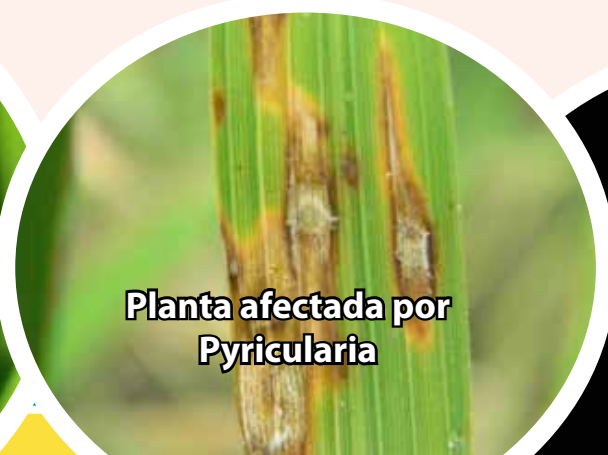
Planta afectada por Pyricularia